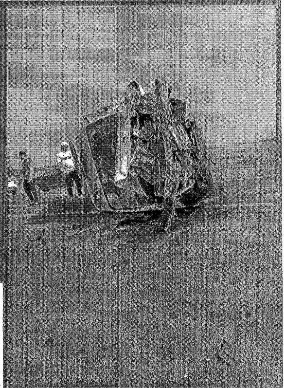
Veículos colidiram de frente na rodovia TO-080, perto de Palmas

MORRERAM NA COLISÃO O MOTORISTA DE UM CARRO DE PASSEIO E A PACIENTE TRANSPORTADA NA AMBULÂNCIA, QUE SAIU DE PARAÍSO COM DESTINO AO HOSPITAL GERAL DE PALMAS PÁGINA 3