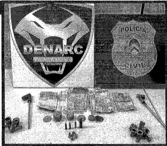
Além das drogas, foram apreendidos dinheiro e munições